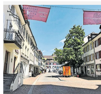
Die heutige Freie Strasse in der Altstadt von Frauenfeld.