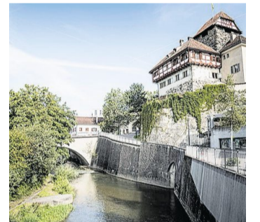
Die Murg bei der Schlossmühlstrasse mit dem Schloss.