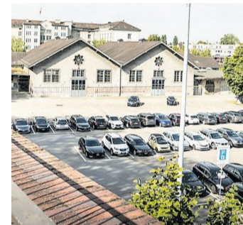
Der Frauenfelder Parkplatz Oberes Mätteli.