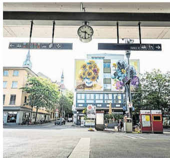
An einem Hitzetag morgens am Bahnhof Frauenfeld.