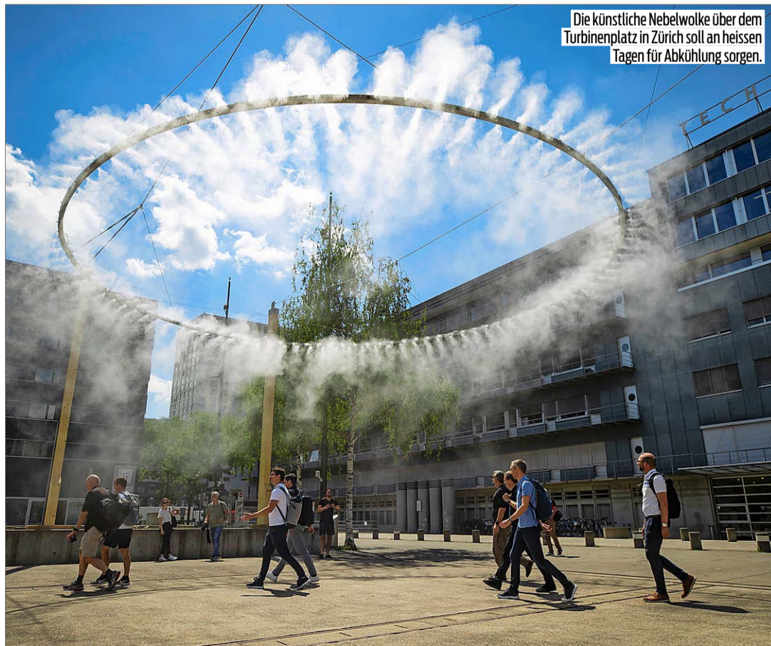
Die künstliche Nebelwolke über dem Turbinenplatz in Zürich soll an heissen Tagen für Abkühlung sorgen.