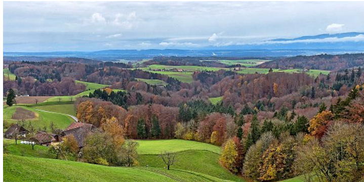
Schöne Aussicht von Ochlenberg Richtung Jura.

In 45 der 86 Gemeinden kamen weniger als 3,3 Erwerbs-